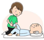
リラクゼーション ストレッチ